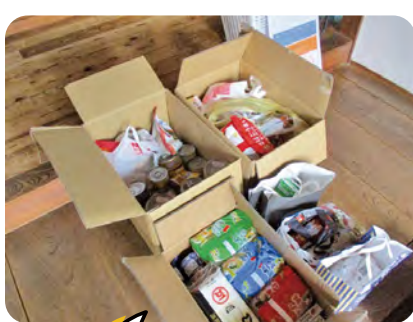
今年春に実施したところ、食品が4箱以上集まりました!

【問い合わせ】社会福祉法人連絡会 社会貢献分科会担当 ☎042-471-0294