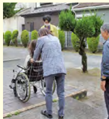
昨年の体験講座の様子

「これからボランティアを始めたい」「地域の活動に興味がある」という方にとって、最初の一歩となる講座です。ぜひお気軽にご参加ください。