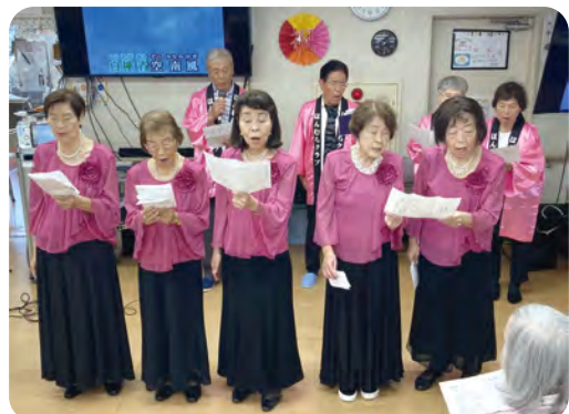
▶ラストは出演者全員で大合唱!

以前は市内複数の高齢者施設を訪問していましたが、コロナ渦で全て中止になり、今年は久しぶりの訪問でした。久老連の奉仕部が中心になって、観ている人も一緒に参加できるプログラムを立てました。