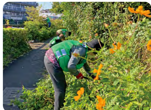
▶茂った雑草を刈り取る作業。キバナコスモスは12月まで楽しめます

久老連で力を入れている奉仕活動のひとつに黒目川添いの花壇づくりがあります。月に1回、門前会と福寿会など久老連の有志が大門町橋に集まって、花壇の手入れをしています。落合川や黒目川の豊かな水環境は、多くのボランティアで支えられている東久留米市の特色のひとつです。久老連の皆さんもその一助となり、汗を流して花壇づくりをしながら、行きかう人と笑顔で挨拶を交わしていました。