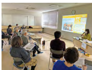
補助金交付団体による実践報告会の様子

地域住民が主体的に参画し、その自主性と創造性により実施される地域福祉活動を対象に経費の一部を補助(上限15万円)することで、地域福祉の推進を図ります。