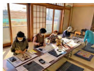
みんなのえんがわ中央町で書き初め

住民主体で取り組む小地域福祉活動(地域における居場所づくり)をバックアップします。