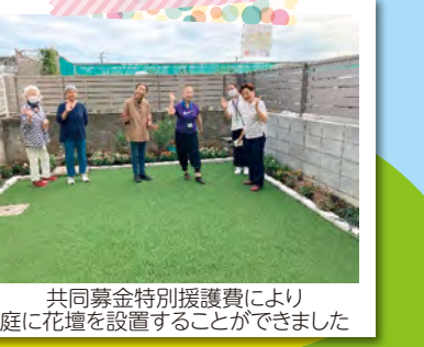
共同募金特別支援費により庭に花壇を設置することができました