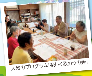
共同募金特別支援費により庭に花壇を設置することができました