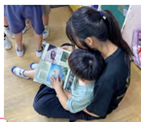
夏休みのチャレンジボランティアで絵本の読み聞かせ

ボランティア活動を身近なものとして、ボランティアの担い手になるきっかけづくりをすすめます。