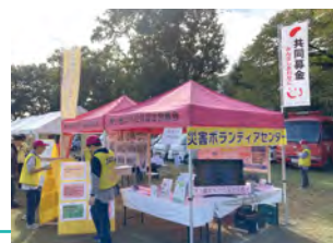
市総合防災訓練で災害ボランティアセンターを周知

災害時の災害ボランティアセンターの運営や平常時の訓練、普及啓発活動に協力する市民スタッフを養成し、いざという時でも安心な地域に向け活動します。