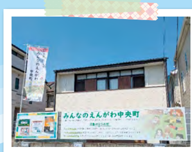
人気のプログラム「楽しく歌おうの会」