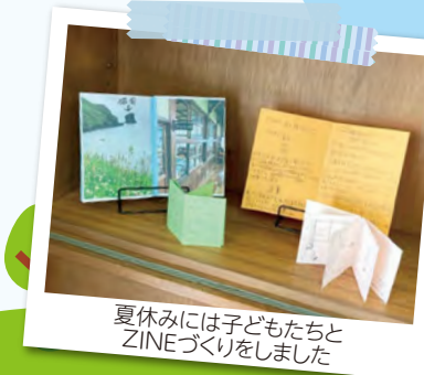
夏休みには子どもたちとZINEづくりをしました