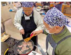
ミニデイホームに登録の「あしたの食卓」料理と食事を楽しんでいます

ミニデイホーム、子育てサロン活動の継続支援と新規活動を促し、地域福祉活動を側面的にバックアップ。日中孤立しがちな高齢者・障がい者・乳児及びその親などを対象として市内各所にて活動中。