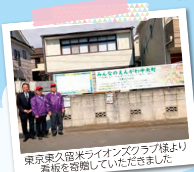
東京東久留米ライオンズクラブ様より看板を寄贈していただきました