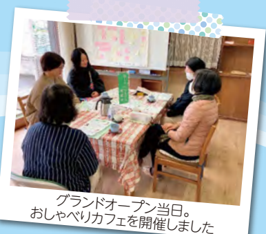
グランドオープン当日。おしゃべりカフェを開催しました