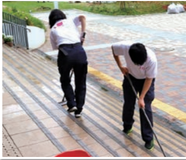
校内で清掃技術を身につける生徒たち