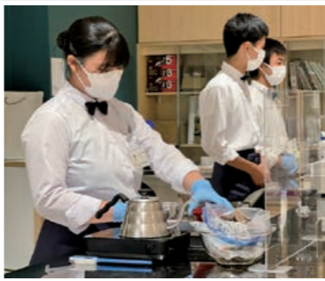
本格的な道具を用いて、生徒がカフェを運営