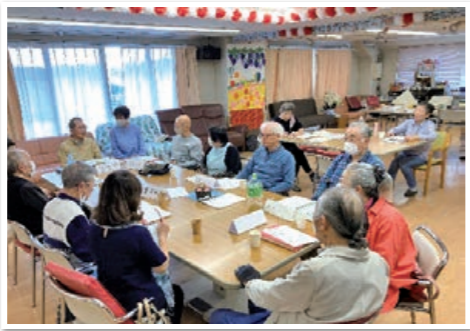
近況報告をしている様子