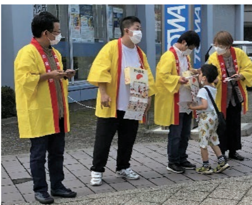
参加:市内社会福祉関連法人延べ13法人、19事業所 3年ぶりの街頭募金、大きな声で呼びかけました