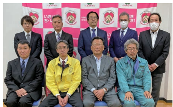
東久留米市建設業協会の皆様と社協事務局長

(株)一光 ひばりが丘SS、(株)因幡電機、(株)奥住造園、大野眼科、オカノ電機(株)、(株)小野工務店、(株)カネマス、(有)川松、さいれ建設(株)、岸製作所、成美教育文化会館、工友土木(株)、(有)井里電業、佐藤税務会計事務所、三協運送(株)、(株)島崎工業所、清水眼科医院、(宗)浄牧院、スナック酔旅館、創英興業(株)、(株)ソーシャルサポート、(株)大樹工業、大生興業(株)、(有)高橋工業、地連歯科診療所、税理士法人 豊田会計事務所、(有)波、西川歯科医院、(株)根本造園、(株)野崎造園、(株)藤本チェーン、前沢医院、松村園芸(株)、(有)モトハウス・アルファ、(有)山下商事、進栄電気工事(株)、久留米設備工業(株)、(株)野島電友社、匿名3件