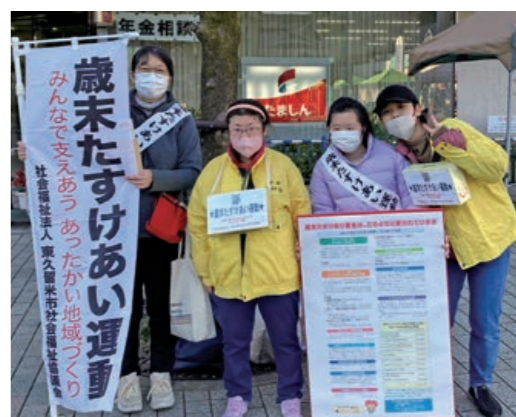
(参加) 社協個人ボランティア登録ボランティアグループ、歳末たすけあいを財源とする社協補助金利用団体、市内社会福祉関連法人、延べ90人、社協役員等有志

12月1日(金)、9日(土) 午後2時~3時45分、1日(金) 午後5時半~6時半、22日(金) 午後6時~7時半