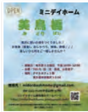
ミニデイホーム美鳥橋チラシ

東久留米市社協には、地域のボランティアが企画・運営する「支えあいの居場所」に23団体が登録しています。『ミニデイホーム』は高齢者や障がいを持つ方を対象にしており、定期的に集まって互いに見守り合ったり、支え合ったりすることを目的に活動しています。