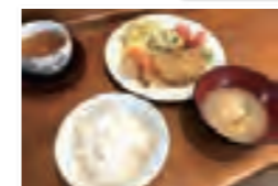
栄養バランスを考えた食事