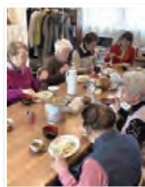
参加者とスタッフで昼食

菜を、みんなでいただきます。参加者からの「美味しい。レシピを教えてください」という声も聞こえました。