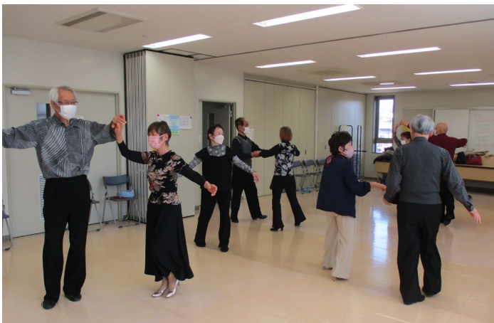
2階の2つの会議室を借り切って踊ります