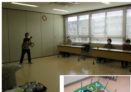
「輪投げ」は大会で使う用具で競います。本格的です！