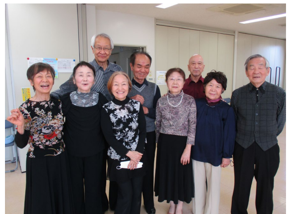
気の合った仲間が集まっています