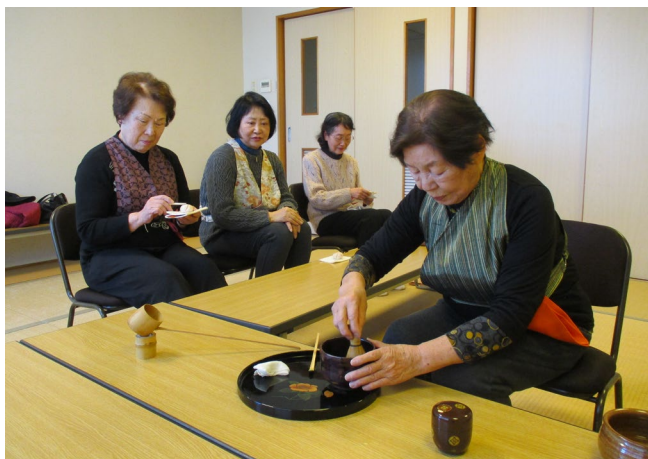
「茶道」でも膝を曲げて座るのが辛い方は高座いすを使います

《センターから》 中央町地区センターでは、中央クラブ以外に、丸実会、銀杏会、悠々会、ほんむらクラブなどがよく利用されています。