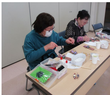
「手芸」は細かく地味な作業ですが、おしゃべりしながら楽しく作品を作ります