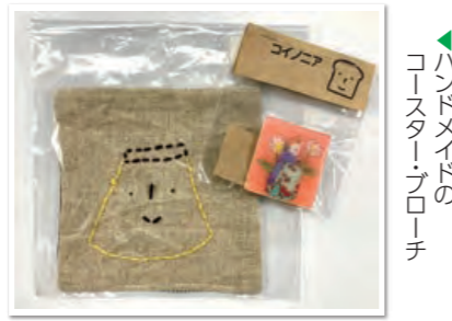
ハンドメイドのコースター・ローチ

NPO法人コイノニアは、滝山にあるパン・洋菓子の店(株)メルヘンで、障がいを持つ人の就労支援の場を始めたことにルーツをもつ団体です。滝山作業所ではパンや洋菓子、八幡作業所(はちまんちょうコイノニア)では軽作業やハンドメイド作品の制作、販売をしています。