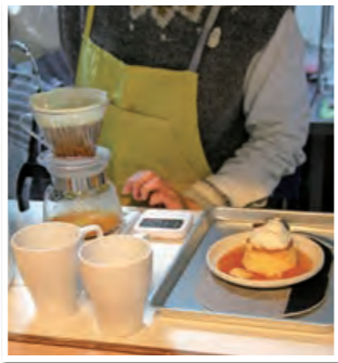
コーヒーを丁寧にドリップ

令和5年4月から週1回、空き家を活用したコミュニティスペース「オナガハウス」(本町)を借りて、はちまんちょうコイノニアの利用者とスタッフが「コイノニアカフェ」をオープン。店内では、パンやプリンを食べることができます。提供するコーヒーや紅茶に敷くのはハンドメイドのコースター。コイノニアのみんなでもてなすカフェになっています。