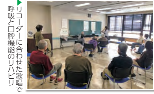
呼吸と口腔機能のリハビリ