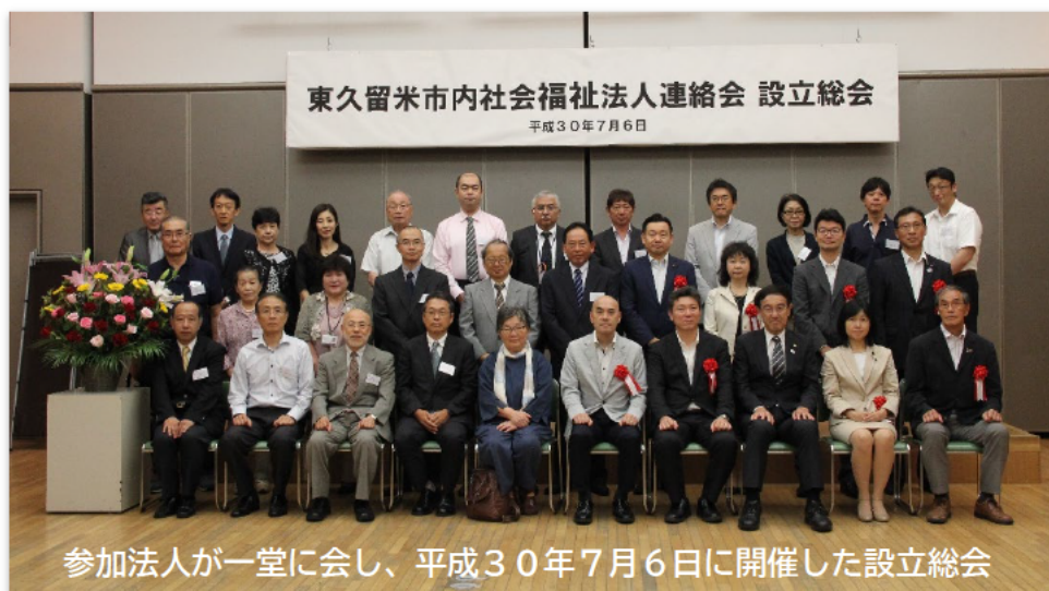
参加法人が一堂に会し、平成30年7月6日に開催した設立総会