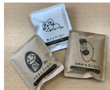
特別なひとときに！プレゼントにも最適です