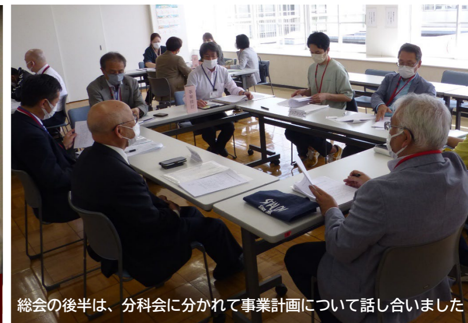
総会の後半は、分科会に分かれて事業計画について話し合いました