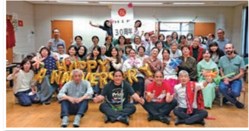
▲30周年 みんなでお祝い「ハッピーバースデー」

今年30周年を迎えた東久留米国際友好クラブ(HIF)は、日本語の学習支援を中心にした草の根の活動から、多文化共生の地域づくりに大きな力を発揮しているボランティア団体です。