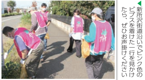
◆新所沢街道沿いでピンク色のピブスを着た一行を見かけたら、ぜひお声掛けください

プラタナスの葉が描かれた色鮮やかなピンク色のピブスを着用することでモチベーションを高め、「楽しく」をモットーに活動しています。