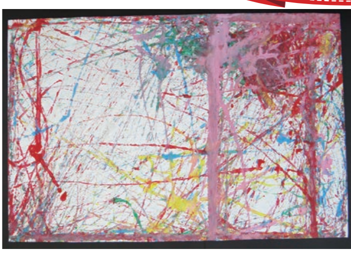
わくわく学園生徒 による共同制作作品