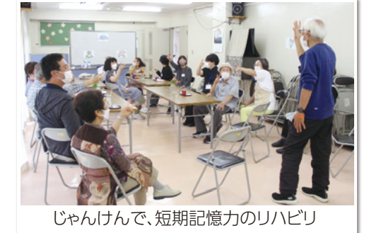
じゃんけん、短期記憶力のリハビリ

「最近悲しかったこと、つらかったこと」。それぞれが自分を見つめて言葉にするのを、みんなで耳を傾けます。時に一緒に笑って、一緒に悲しむ語らいは、ひとりひとり違うけれど、その気持ちはひとりだけじゃない、不思議な心強さと分かち合いがありました。