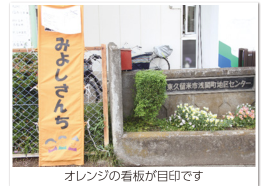
オレンジの看板が目印です