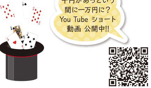
千円があつという間に一万円に? You Tube ショート動画 公開中!!

マジックBOX ■活動日 第1、3木曜日 午後7時~午後9時 ■場所 生涯学習センター ■費用 入会金1,000円 会費月1,000円 ■問い合わせ マジックBOX 代表 松澤 亮 ☎080-5014-6022