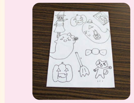
ハロウインの塗り絵 (第一小学校4年生・女子)