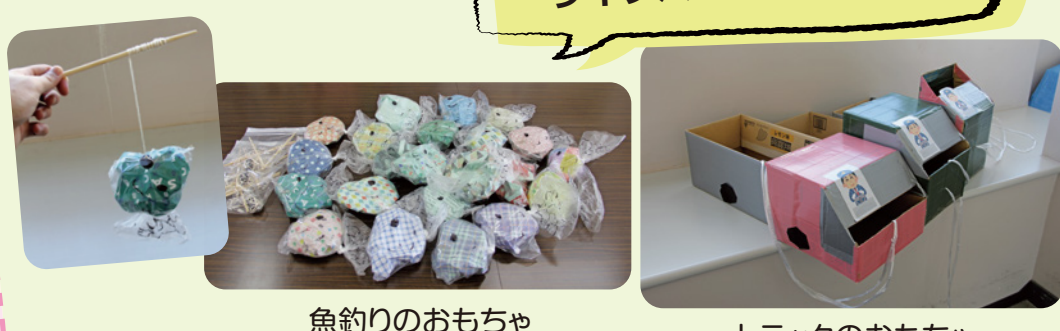
魚釣りのおもちゃ