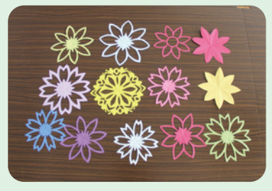
手づくりの紙飾り (杉並学院高校2年生・男子)