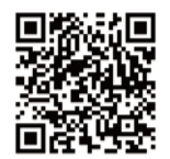
社協HP地域協働事業

(※2) 地域共生社会とは 制度・分野ごとの「縦割り」や「支え手」「受け手」という関係を超えて、地域住民や地域の多様な主体が参画し、人と人、人と資源が世代や分野を超えてつながることで、住民一人ひとりの暮らしと生きがい、地域をともに創っていく社会を指しています。(厚生労働省 地域共生社会のポータルサイトより)