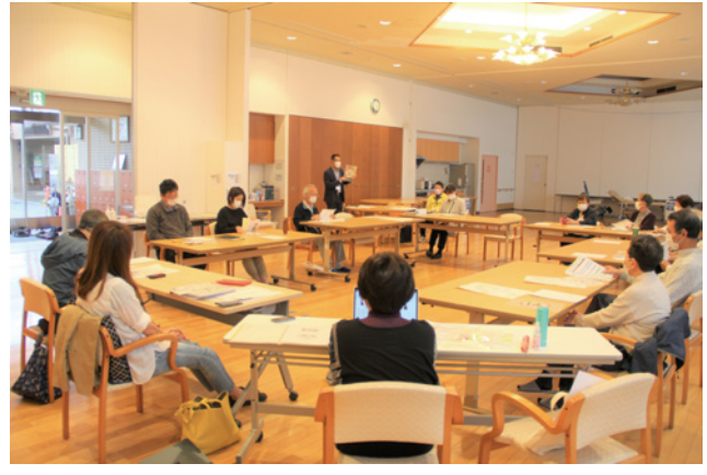
自治会役員、住民有志、車いす利用者、市防災防犯課も参加。近隣の他市避難所への経路の点検について話し合う

機関とのつなぎの他、取り組みや成果が見える化され、皆で評価することができる仕組みづくりをお手伝いしています。 引き続き、一人ひとりが主体的な立場で生活上の課題を捉え、行政や関係機関と連携しながら解決に向けて取り組み、他の地域にも「住みよいまち」を広げる予定です。地域づくりに関する困りごとや悩みもお気軽にご連絡ください。