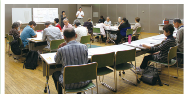
市民スタッフの役割を学ぶ受講生

※新型コロナウイルスの感染拡大の状況により、日時等を変更する場合があります。詳しくは、社協ホームページをご覧ください。