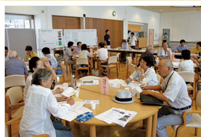
「住みよいまちにするために自分たちができることは何か?」顔の見える関係をひろげるために話し合う弥生地区の皆さん

ご近所でいつもと様子が違うなと感じることや気になること、どこに相談したらよいかかわからないことなどお気軽にご連絡ください。