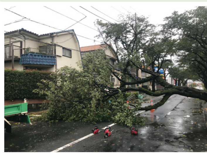
昨年の台風で市内でも倒木がありました